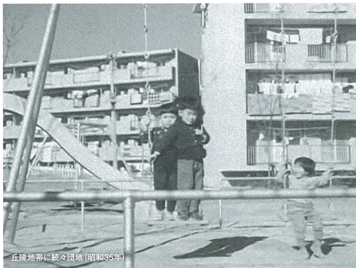
丘陵地帯に続々団地(昭和35年)

川崎市の人口が2017年4月に150万人を突破し、2024年には市制100周年を迎えます。市内、区内に新住民が増える一方で、麻生区に居住する人のなかには、昭和時代の麻生区の姿を知らない人も多くなり、地元への関心も薄れつつある昨今、「川崎市政ニュース映画」麻生区編を広く区民に公開することで郷土愛を育み、区民に愛される麻生の地とするために、この上映イベントを実施したいと思います。