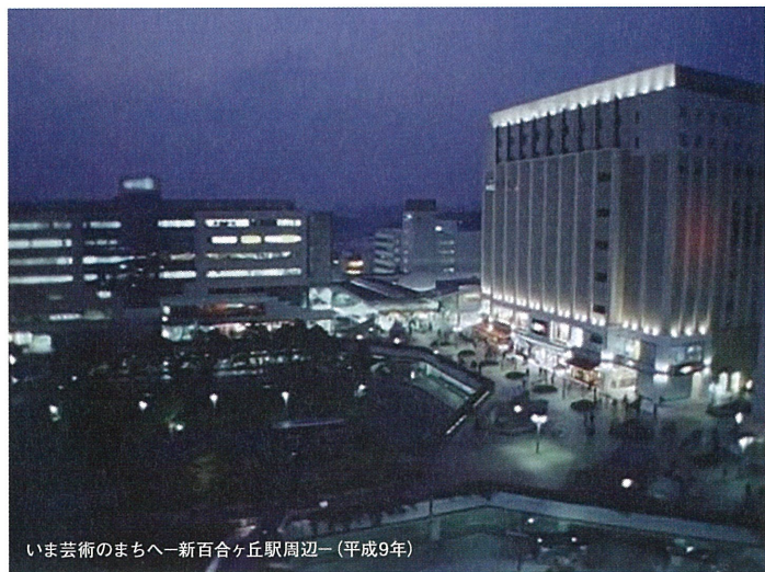
いま芸術のまちへー新百合ヶ丘駅周辺ー(平成9年)

上映内容(予定)：早春の王禅寺／指定都市スタート／造成すすむ岡上菅農団地／さよなら黒川分校／ヨネッティー王禅寺オープン／柿生の里に”禅寺丸柿”実る／KAWASAKI しんゆり映画祭 など