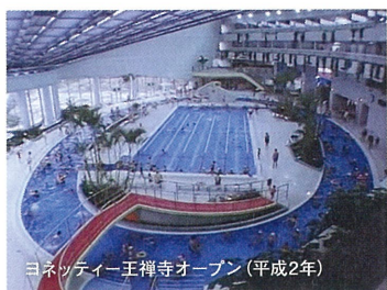
ヨネッティー王禅寺オープン(平成2年)