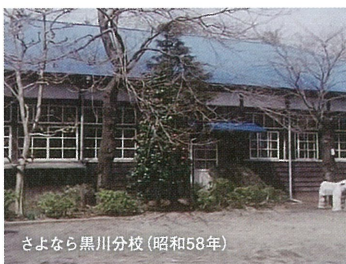
さよなら黒川分校(昭和58年)