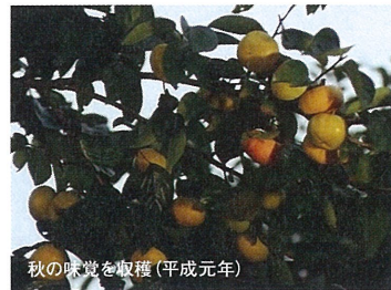
秋の味覚を収穫(平成元年)