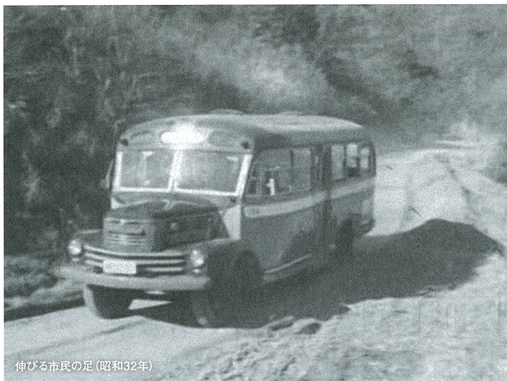
伸びる市民の足(昭和32年)